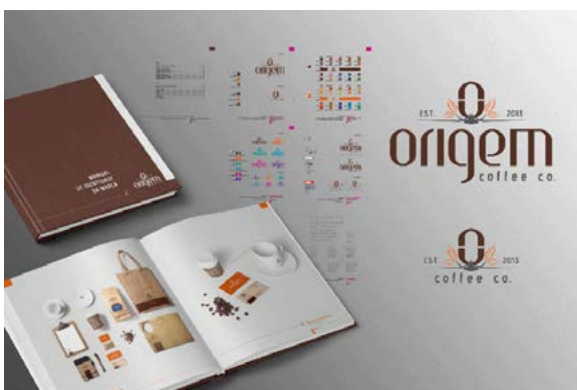
Marca e MIV