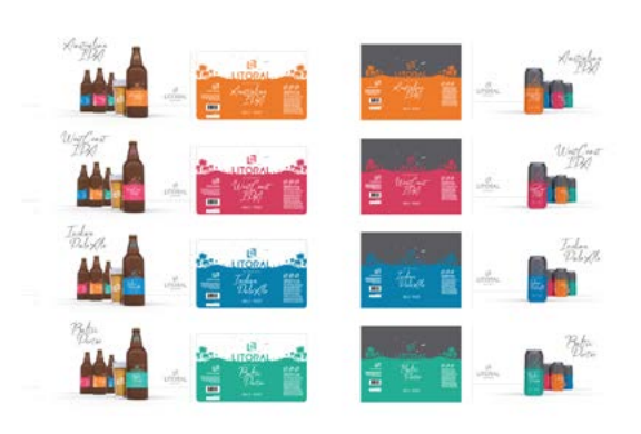
Design de produto