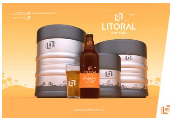
Design de produto